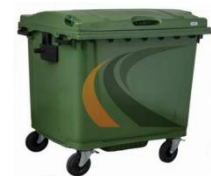
Контейнеры для сбора мусора