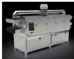
Машины мойки тары