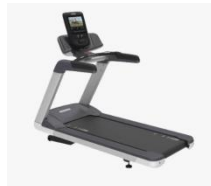
Оборудование для фитнеса